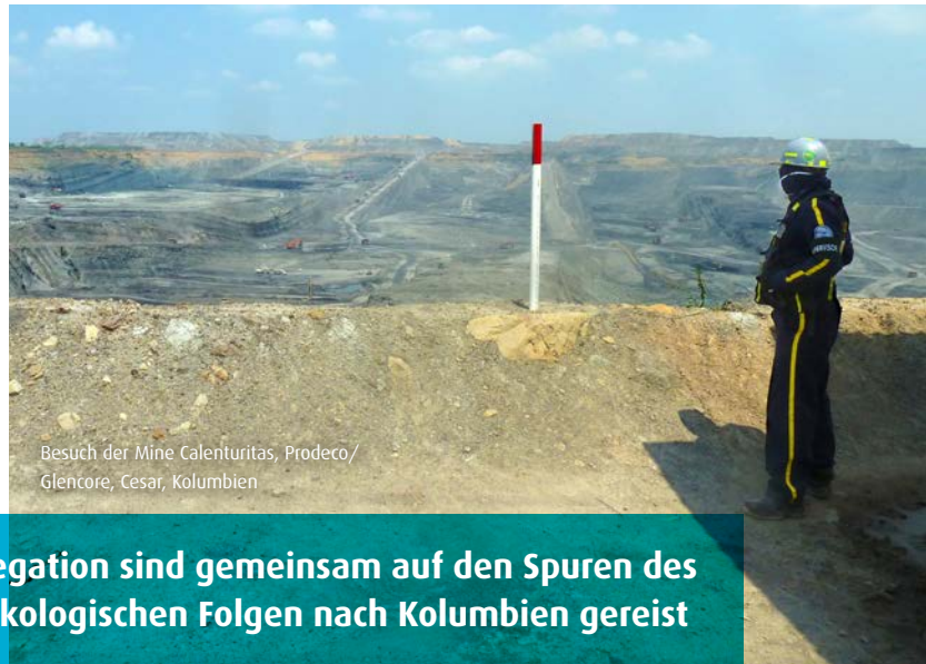
Besuch der Mine Calenturitas, Prodeco/ Glencore, Cesar, Kolumbien

Der Energieversorger EnBW und eine NGO-Delegation sind gemeinsam auf den Spuren des Steinkohlebergbaus und seiner sozialen und ökologischen Folgen nach Kolumbien gereist