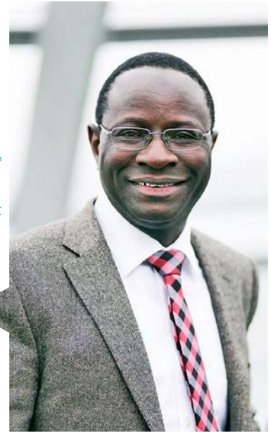
Dr. Karamba Diaby, Mitglied des Deutschen Bundestags